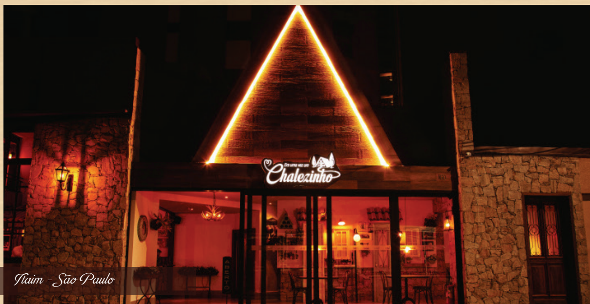
Itaim - São Paulo