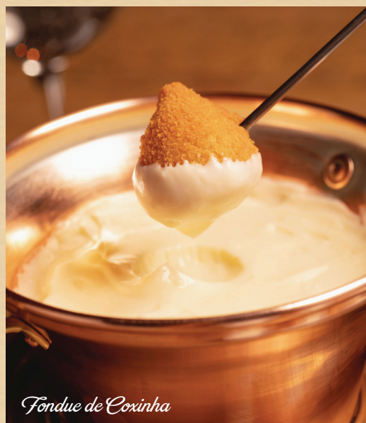
Fondue de Coxinha