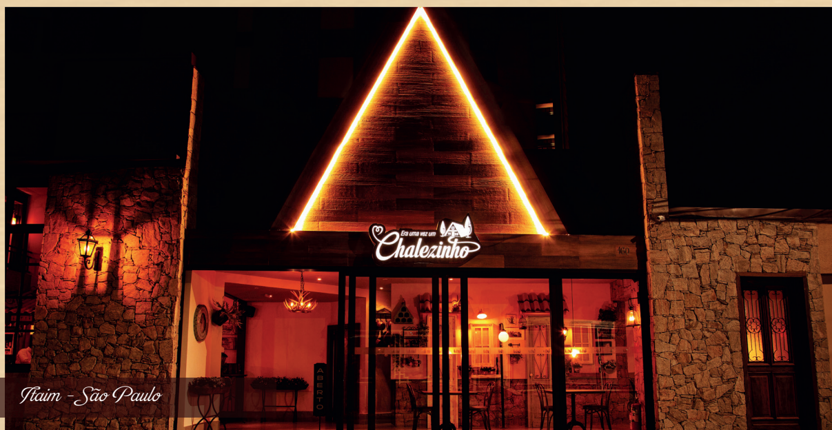
Itaim - São Paulo