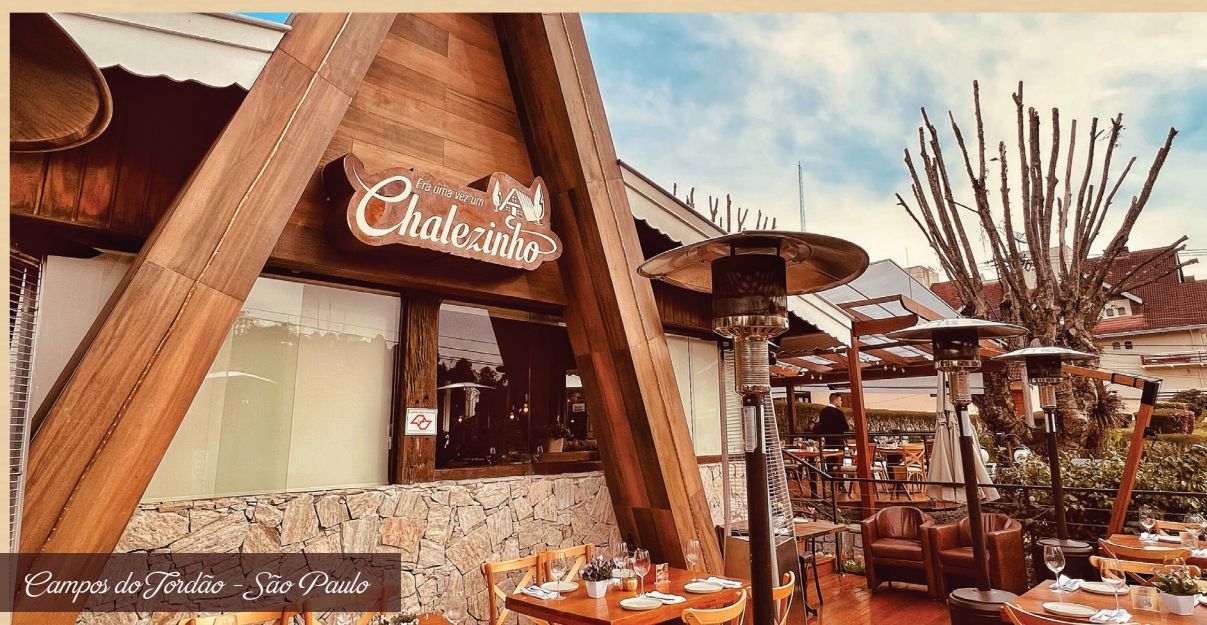
Campos do Jordão - São Paulo