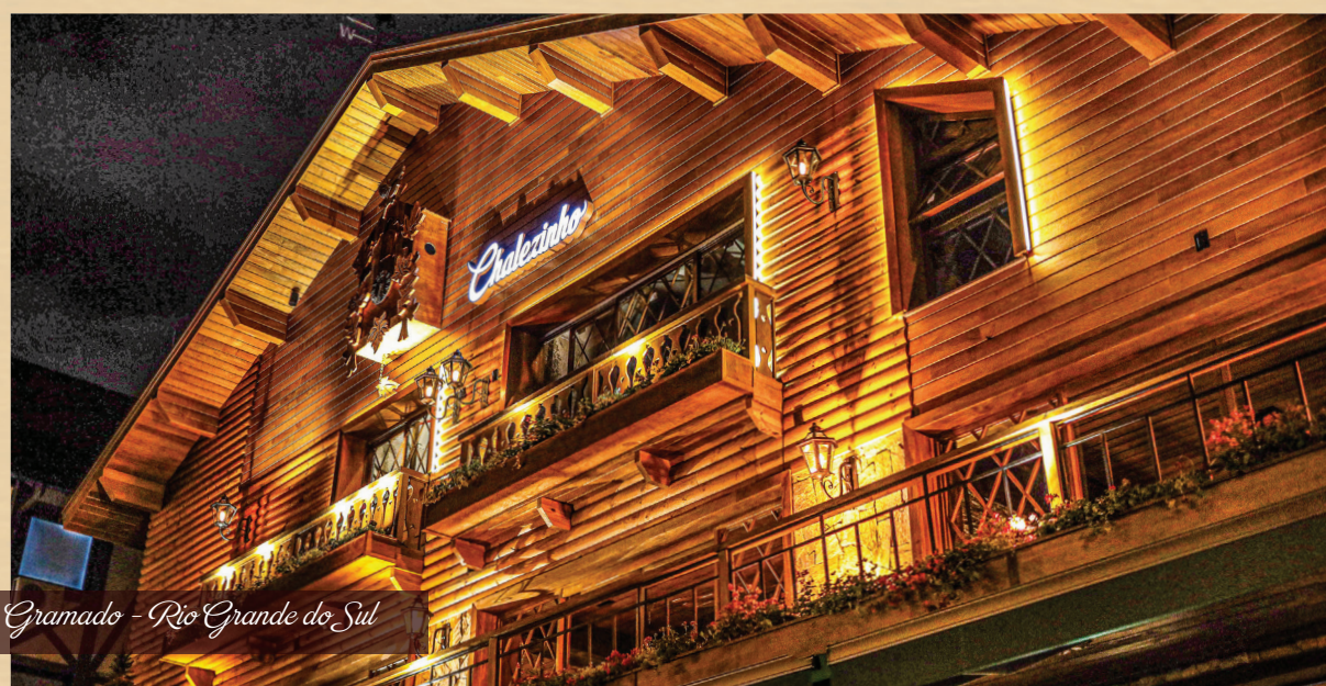
Gramado - Rio Grande do Sul